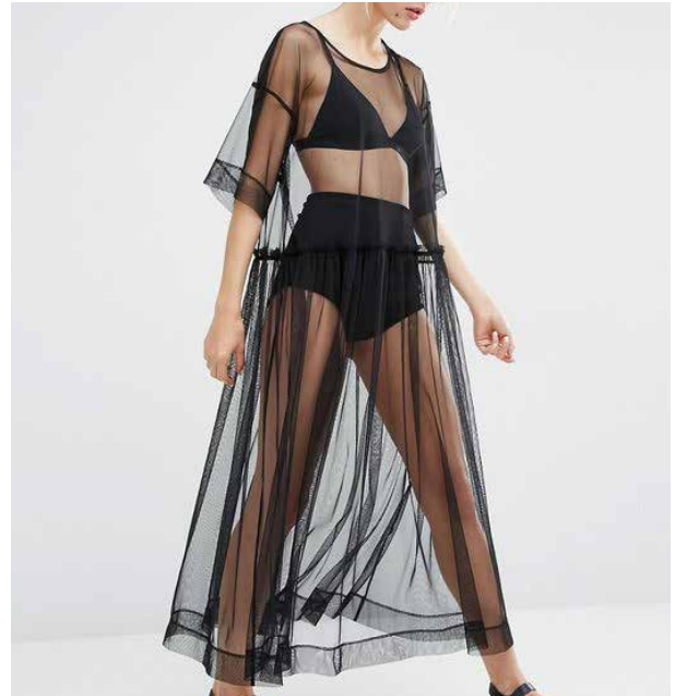
La sensación de desnudez y muda de piel es constante a lo largo de la obra, por tanto apostamos por un estilismo dejando ver el cuerpo de las actrices, con tejidos translúcidos y fluidos.