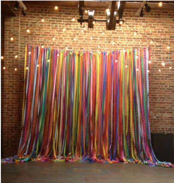
El uso de estos materiales y su disposición en el espacio buscan crear «capas» dentro del escenario.